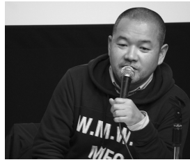
大根仁『バクマン。』『いだてん』