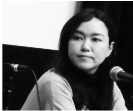
奥寺佐渡子『おおかみこどもの雨と雪』