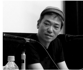
喜安浩平『桐島、部活やめるってよ』