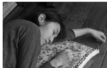
2012年度高等科 コラボレーション作品 『イヌミチ』