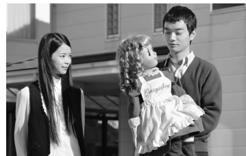
第1期初等科作品 『ただいま、ジャクリーン』