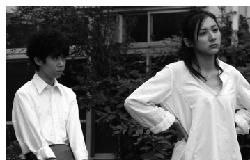
第2期初等科作品 『坂本君は 見た目だけが真面目』