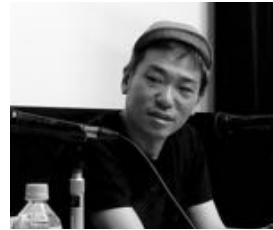
喜安浩平『桐島、部活やめるってよ』