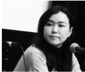
奥寺佐渡子『おおかみこどもの雨と雪』