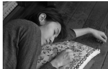
2012年度高等科 コラボレーション作品 『イヌミチ』