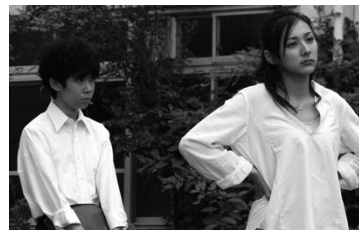
第2期初等科作品 『坂本君は 見た目だけが真面目』