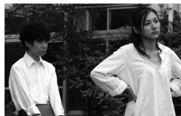
第2期初等科作品 『坂本君は 見た目だけが真面目』