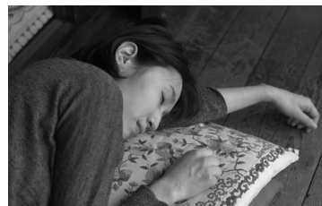
2012年度高等科 コラボレーション作品 『イヌミチ』