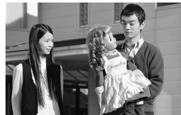
第1期初等科作品 『ただいま、ジャクリーン』

『坂本君は見た目だけが真面目』(監督: 大工原正樹/脚本: 鳥井雅子/2014)